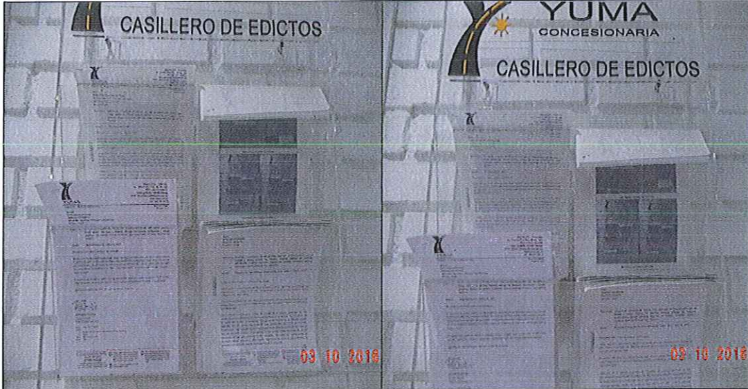
EDICTOS DE LA R_14375 y la R_14871 YC-CRT-44691